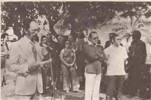
Apertura di Aruba su promer feria popular di artesanía.

Tambe tin programanan cultural tur siman na television.